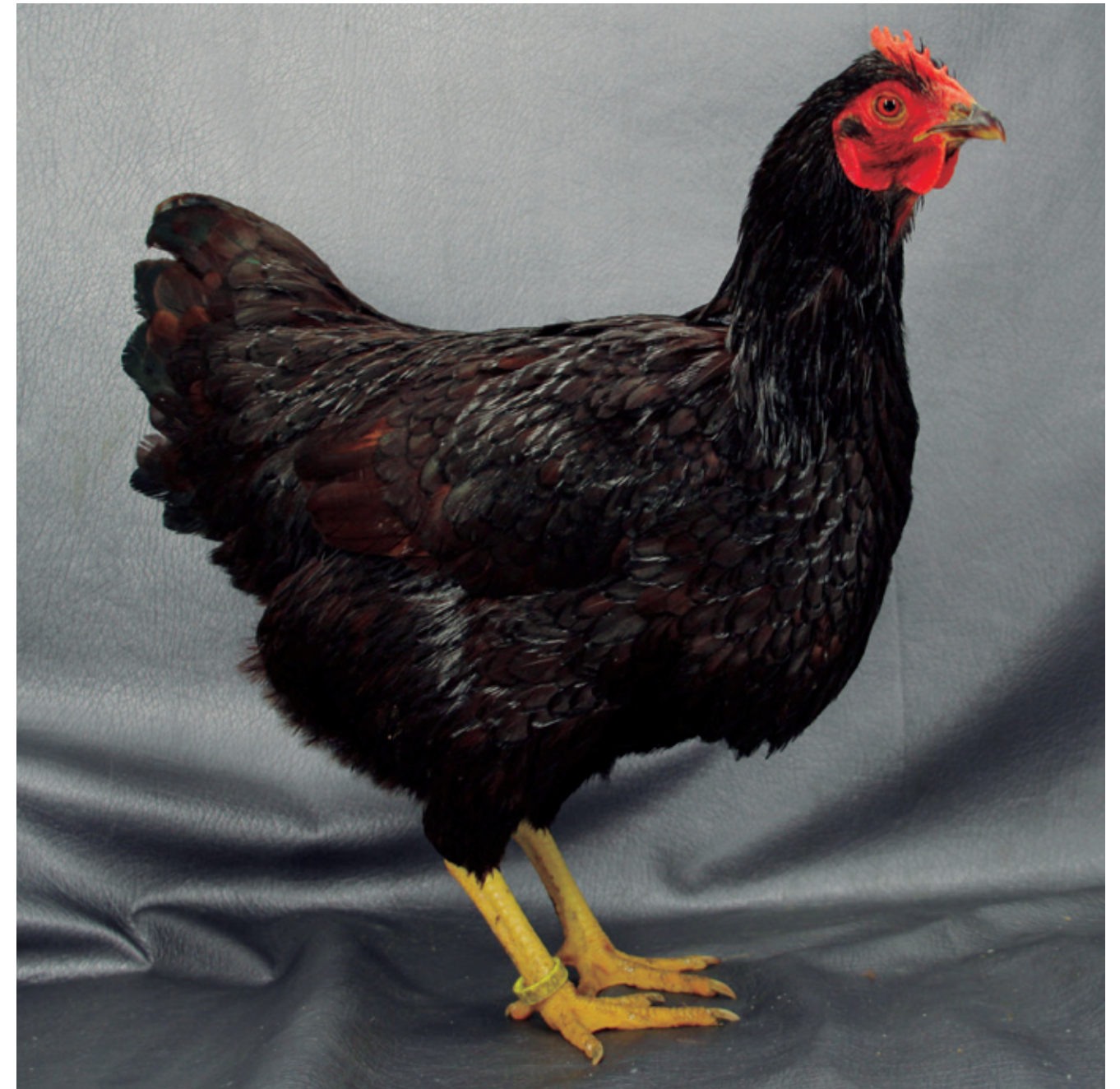
Variedades unicolor 16. Rhode Island