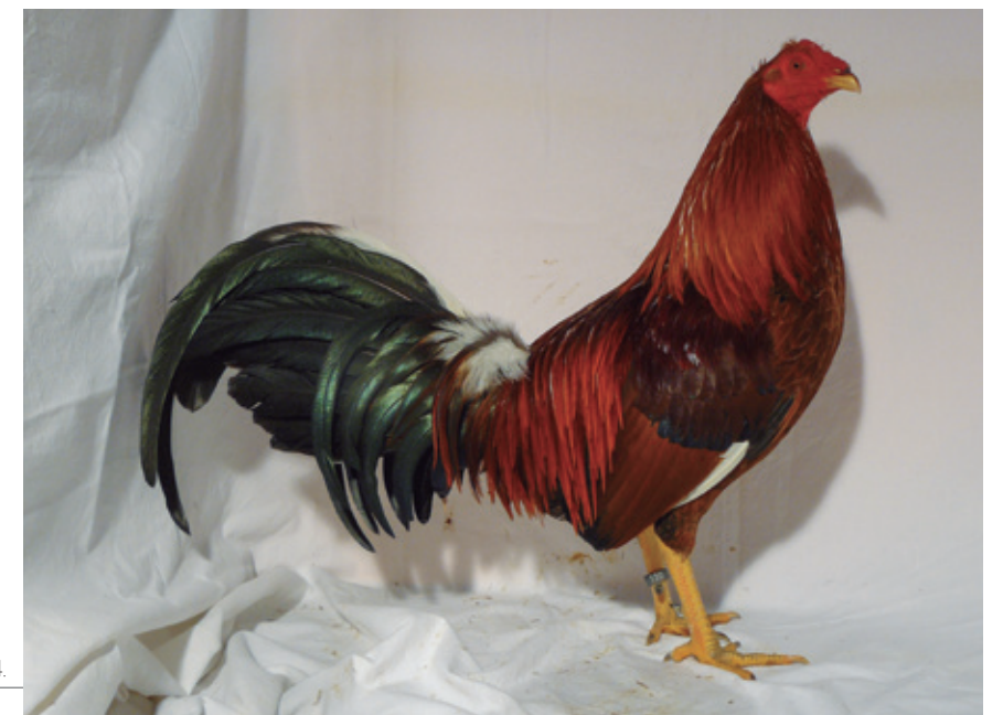
Varietades ancestrales 2.4. Combatiente Español