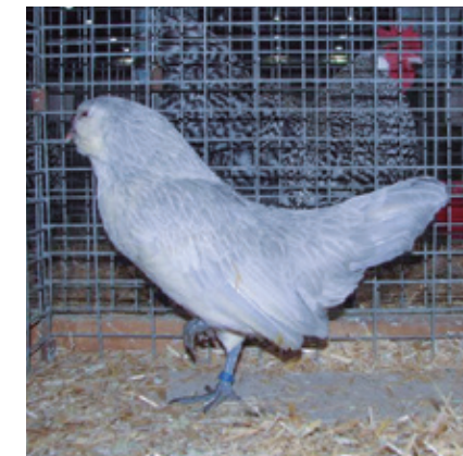
Codorniz lavanda plata