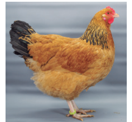
Leonado armiñado en negro