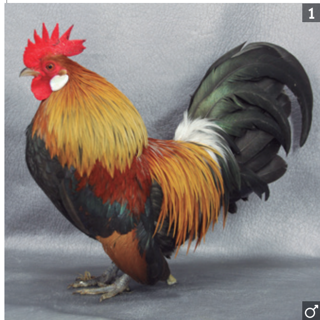
Varietades ancestrales 2.1. Holandesa Enana