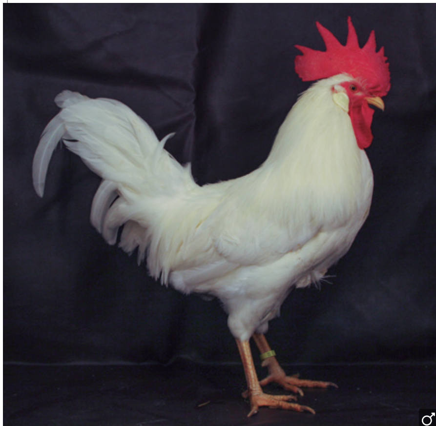
Variedades unicolor 11. Leghorn