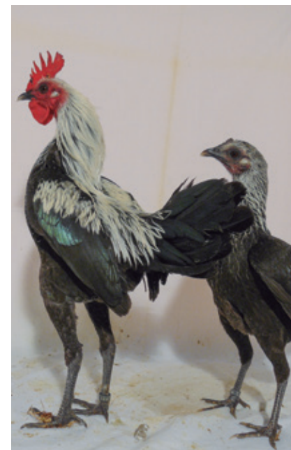
Abedul negro plata

Patrones de color ligados fundamentalmente al diseño de las plumas que posee el animal. Se llamarán: barrada autonómico, barrada sexual (acuérdate que incluye barrado y cuclillo), pincelada, ribeteada, ribeteada doble, lentejuelada, mallada múltiple, etc.